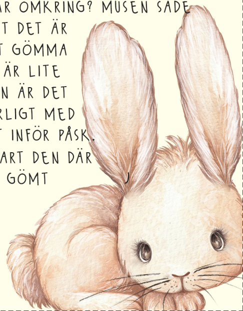
Brev 6 - dagen innan påskafton