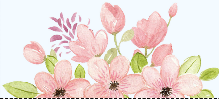
Brev 8 - Lillharen flyttar ut

JAG HAR TRIVST SÅ BRA HÄR HOS ER OCH JAG HOPPAS ATT VI KANSKE SES NÄSTA ÅR IGEN? MÅNGA SKUTTIGA HÄLSNINGAR FRÅN MIG, LILLHAREN