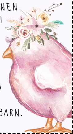
Brev 7 - Påskaftonsmorgon

SKYND ER NU OCH BÖRJA LETA EFTER JUST ERAT ÄGG! VARJE INNEHÅLL ÄR UNIKT FÖR ALLA BARN.