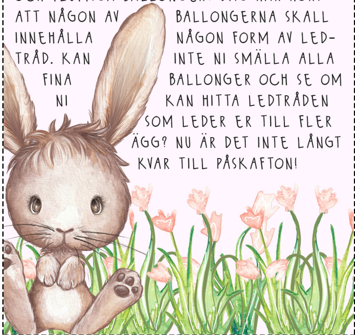
Brev 5 - 2 dagar innan påskafton

HAR NI SETT ETT SÅDANT HAV AV HÄRLIGA OCH FLUFFIGA BALLONGER? JAG HAR HÖRT ATT NÅGON AV BALLONGERNA SKALL INNEHÅLLA NÅGON FORM AV LEDTRÅD. KAN NI FINA NI BALLONGERNA SKALL NÅGON FORM AV LEDINTE NI SMÄLLA ALLA BALLONGER OCH SE OM NI KAN HITTA LEDTRÅDEN SOM LEDER ER TILL FLER ÄGG? NU ÄR DET INTE LÅNGT KVAR TILL PÅSKAFTON!